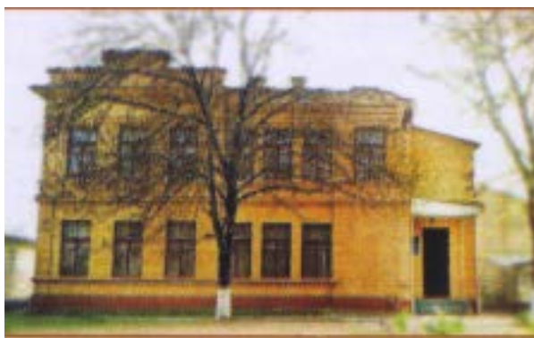
Симферополь. Караимская девичья школа им. Э.Ч. Коген