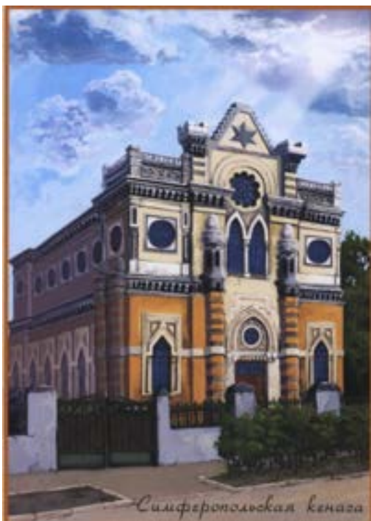
Симферопольская кенаса. Компьютерная реконструкция Г. и В. Бабаджанов