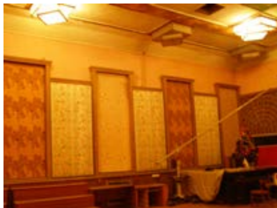
Симферополь. Окна кенаса изнутри. 07.10.2012