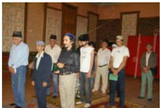
Симферополь. Молебен в кенаса. 07.10.2012