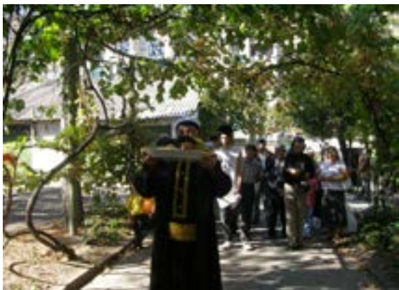
Симферополь. Освящение фруктов во дворе кенаса. 07.10.2012