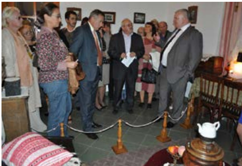
Участники конференции в Музее караимской истории и культур

В Национальном заповеднике «Давний Галич» (Ивано-Франковская область) прошла уже третья за последние десять лет конференция, посвящённая караимам. Она состоялась 17 сентября 2012 года. Её тема: «Караимы и их роль в контексте мирового сообщества».