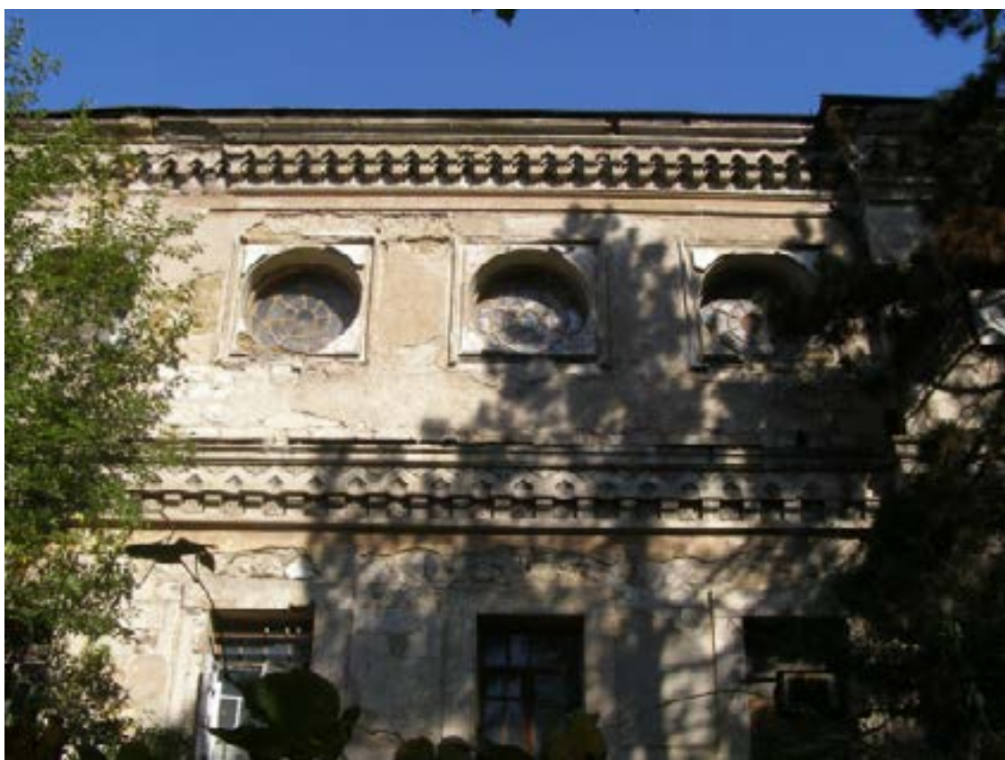
Симферополь. Окна кенаса снаружи. 07.10.2012