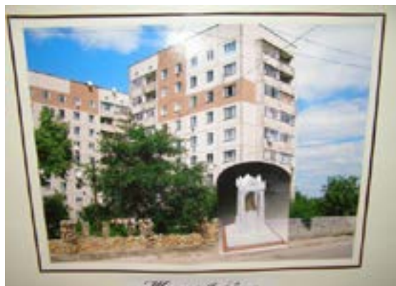
Товарищеский обед. Галич, 17.09.2012