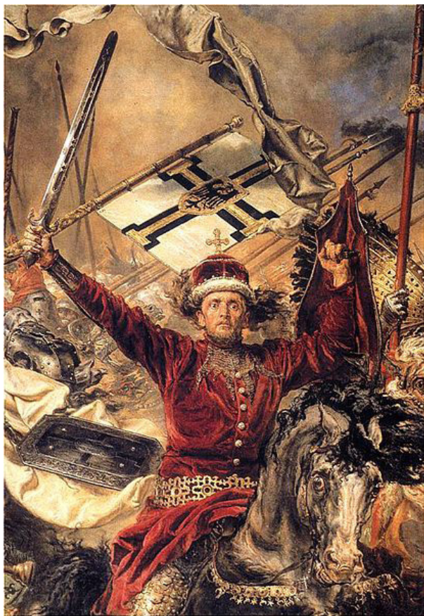
Великий князь Литовский Витовт в гуще боя (фрагмент картины польского художника Яна Матейко «Грюнвальдская битва»)

Чехии и других стран (всего 51 знамя, т.е. войсковое подразделение), оценивается примерно от 15 тыс. человек и более.