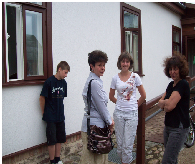
Московские и Петербургские караимы у мидраша