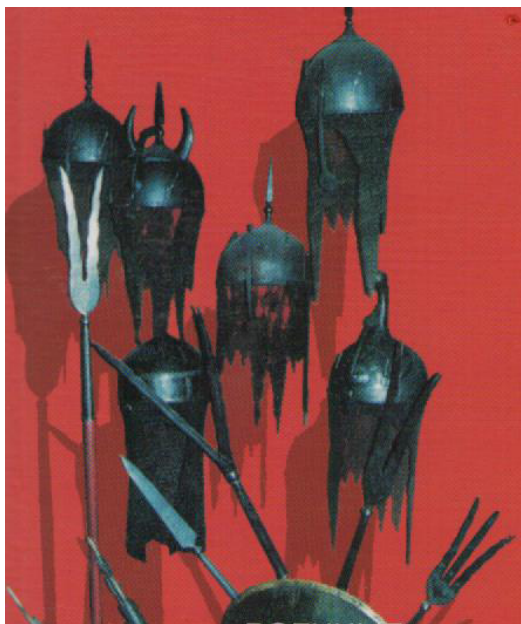
Оружие и доспехи караимского воина