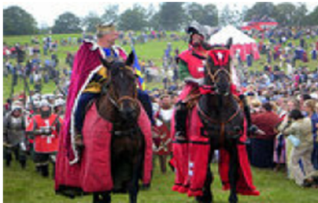
Инсценировка битвы на историческом поле

Так, в Польше с 15 по 18 июля прошли массовые торжества, официальное открытие которых состоялось в древней столице Польши Кракове при участии президента Польши Бронислава Коморовского и президента Литвы Дали Грибаускайте. В Варшаве по улицам прошёл массовый «Грюнвальдский марш». В Варминско-Мазурском воеводстве близ г. Ольштын на поле исторического сражения 120 тысяч человек стали