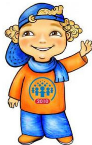
Талисман всероссийской переписи населения

Если Вы пребываете в нашей стране менее года и постоянно проживаете в своей стране, потребуется ещё меньше времени: переписной лист для