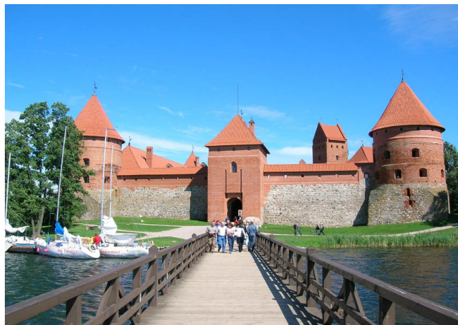
Отсюда уходила на битву Трокская хоругвь.

У автора нет на руках конкретных документов или ссылок на них, подтверждающих участие караимов в Грюнвальдском сражении. Однако логика развития военно-исторических событий в Литовском государстве той эпохи и известные нам их подробности однозначно говорят об участии крымских караимов в Грюнвальдской битве.