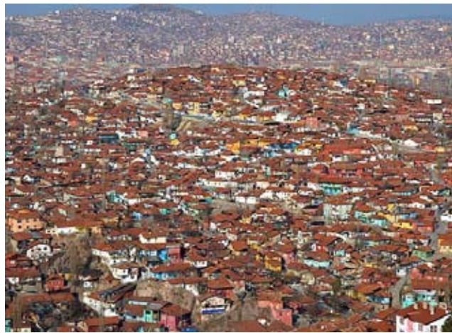
Частный сектор в Анкаре