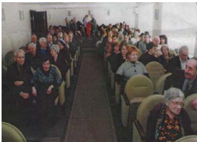
20 лет московскому караимскому обществу

2009 г. знаменателен для крымских караимов российской столицы двумя круглыми датами. 20 лет назад, летом 1989 г. было зарегистрировано первое караимское общество в Москве «Культурно-просветительская ассоциация караимов ИЛК». Следует напомнить, что слово ИЛК означает по-караимски «лидер, ведущий», а по-русски эта аббревиатура раскрывается как «история-литература-культура» или «интернациональная лига караимов». Вторая юбилейная дата касалась нашего печатного органа – газеты «Караимские вести», первый номер которой вышел 14 февраля 1994 г., т.е. ровно 15 лет назад.