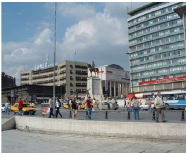
Памятник Ататюрку в центре Анкары