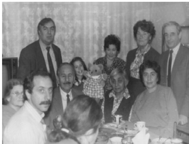
Заседание караимского правления, X-1990г.

28 марта 2009 г. в 13.30 председатель Московского