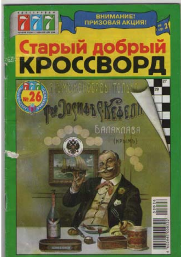
Старинная реклама консервов