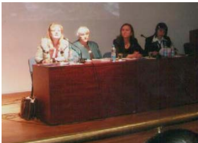
Турция, Анкара, университет Хаджеттепе

«Я действительно ездила в Турцию, в Анкару, где в Университете Хаджеттепе была проведена публичная дискуссия на тему «Историко-социальные и культурные стороны Крыма в прошлом и настоящем». Проводилась дискуссия Институтом истории революции и принципов Ататюрка. Заседание проходило в конференц-зале факультета литературы. Собралось много людей: педагоги, администрация, военные в отставке, преподаватели из других университетов, студенты – всего человек 250.