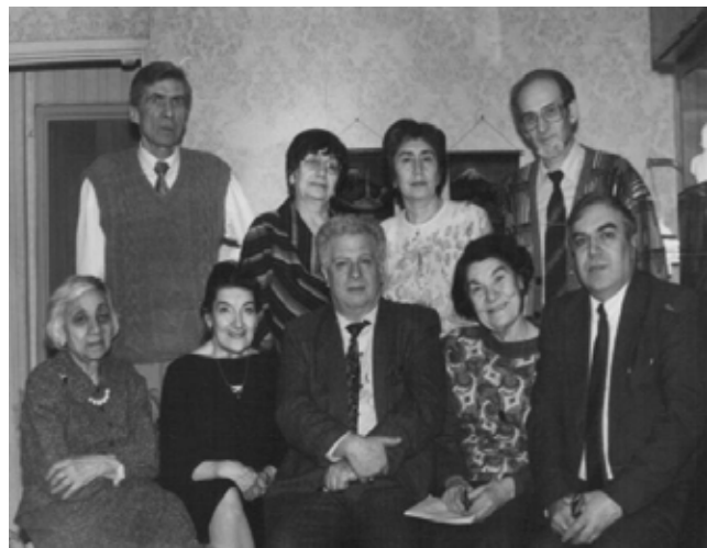
Караимское правление-2, V-1994г.