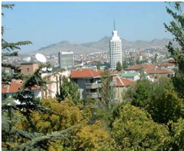
Вид на Анкару