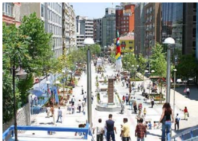
Пешеходная улица в центре Анкары