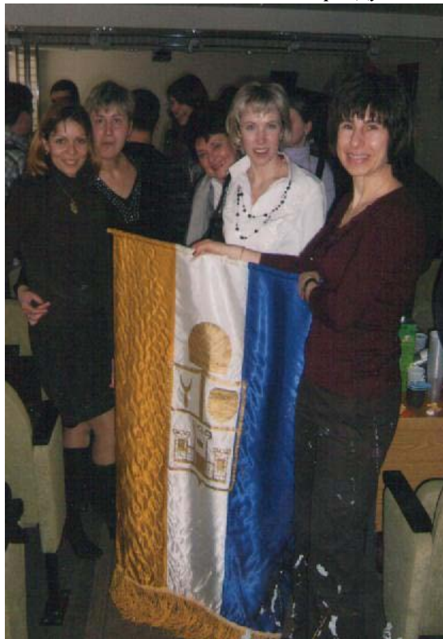
Московские караимки с историческим караимским флагом, с которым они участвовали во всемирном фестивале молодёжи 1991г. в Польше.