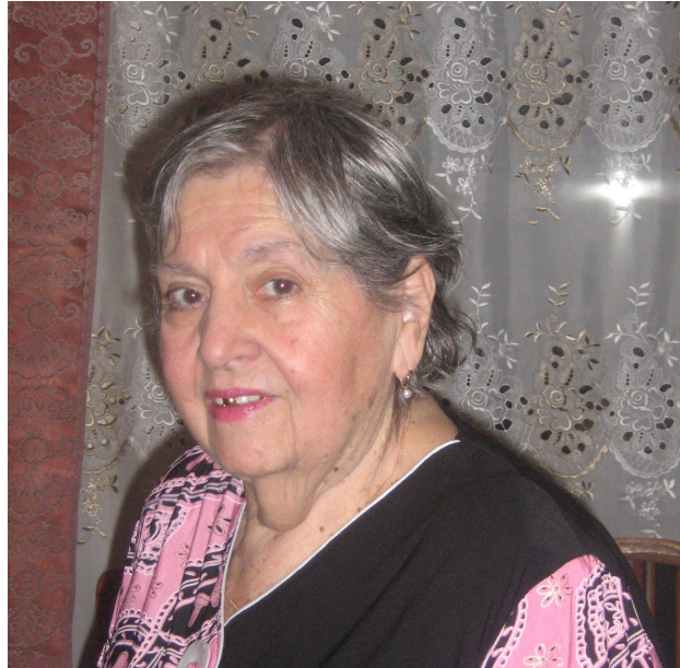
Разве дашь этой красивой женщине 85?

Московское культурно-просветительское национальное общество караимов и редколлегия газеты «Караимские вести» от имени всех наших соплеменников желают Вам счастья и доброго здоровья ещё на долгие годы жизни!