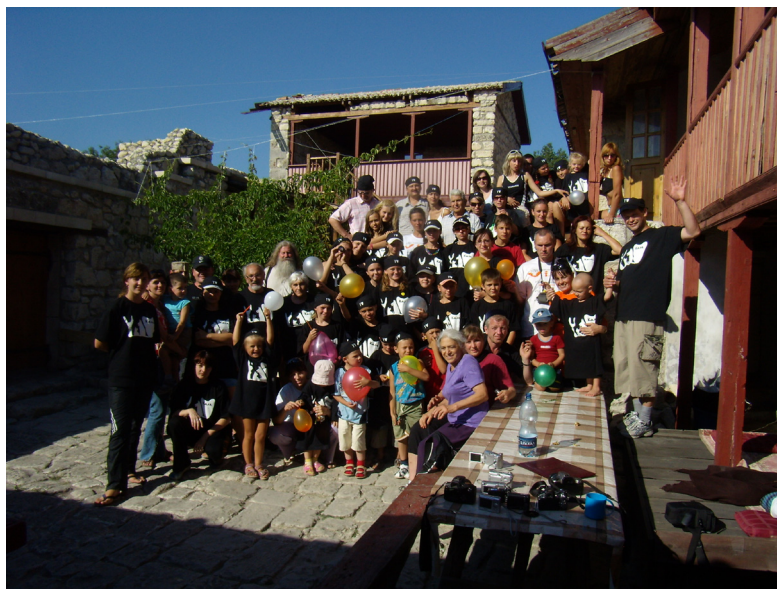
Открытие детско-молодёжного лагеря на Кале

Летом на Джуфт-Кале работал традиционный молодёжный трудовой лагерь, организатором которого уже не первый год выступает этно-культурный Центр «Кале», объединяющий караимскую молодёжь Крыма.