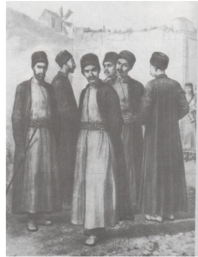
Караимы. XIX век

Здесь они прижились и, потеряв связь с метрополией, налаживали связи с местным населением – киммерийцами, скифами, греками ... Как и в Вавилоне, они несли им свою культуру, навыки, свою открытую религию. Они не приняли Иерусалимских нововведений – религию не закрыли, II Храм не признали, сохранили свой календарь с отсчетом от Самарийского пленения, не признали Устного Закона и трактовок к нему (Талмуда), сохранили древний визуальный метод наблюдения начала лунных месяцев, сохранили свои традиции чтения