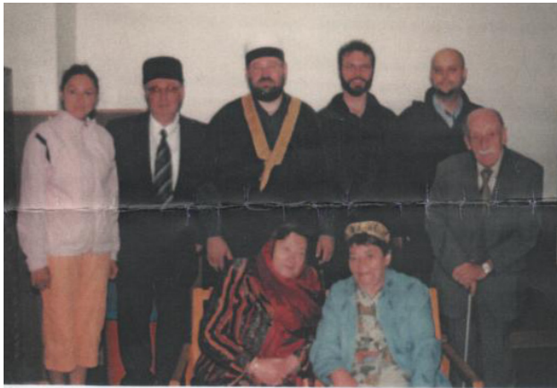
Весь наличный состав конгресса в Праге

звать трудно. А вот по важности принятых решений и документов его можно было бы назвать даже международным съездом, ... если бы не многочисленные «но». Рассмотрим подробнее, кто был организатором и участниками пражского мероприятия, какие вопросы рассматривались и что за документы были разработаны.