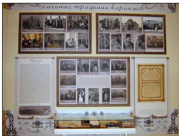
Стенд и витрина, посвящённые караимам