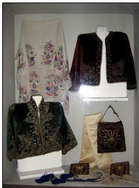
Один из стендов караимской экспозиции в Историко-краеведческом музее Феодосии

экспозиции посчастливилось увидеть редкие караимские дореволюционные издания и вещи, брачные договоры – шетары, религиозные атрибуты и даже ажурные кованые ворота от старого караимского дома. Караимская экспозиция была оформлена профессионально и с большим уважением к нашему малочисленному народу. Однако по выходе из здания в музейный двор положительное впечатление от выставки быстро испортилось самым неожиданным образом: шагая к воротам музея по каменным плитам двора, мы увидели вдруг среди плит фрагменты памятников со старинного караимского кладбища Феодосии. На протяжении нескольких десятилетий памятники с бесхозного кладбища вывозились на различные хозяйственные нужды. Так, воинская часть построила себе из наших памятников