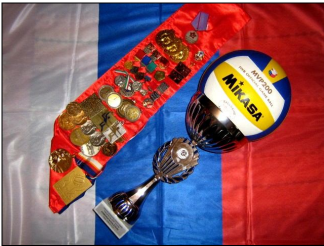
Награды М. Кумыш