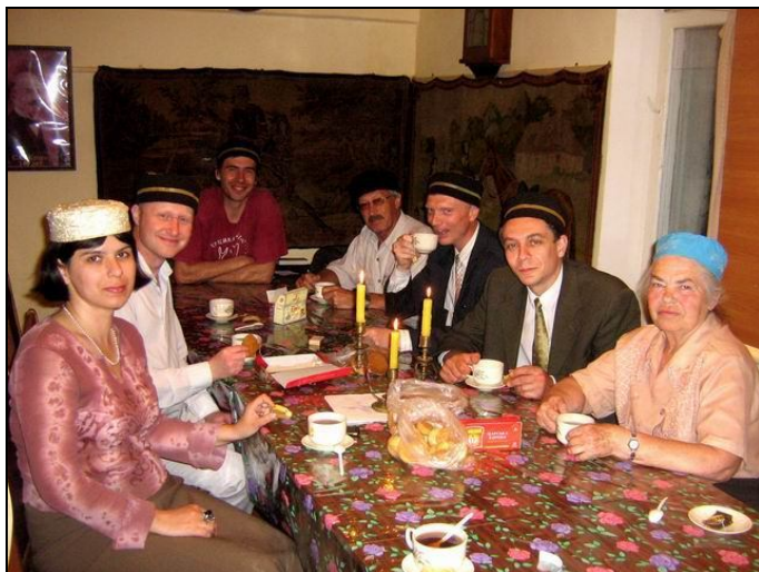
Субботнее собрание караимской религиозной общины Феодосии

Марковича Шапшала. Стать участником этого нерадового мероприятия я тоже планировал еще в Москве, поскольку по бабушкиной линии он приходится мне родственником, а точнее – дед Серая Марковича является моим прадедом.